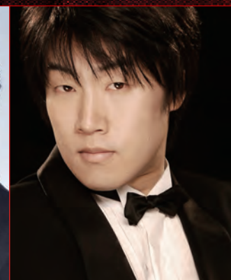
加藤宏隆 (バスバリトン)